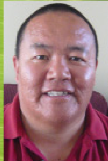
ཚུམ་གླིང་ལ། དགའ་ལྷོ་ལྷོ་བཟང་ལུན་གྲུབ།

Kalsang Gyaltzen Lhopa Khangtsen Gashar Monastery P.O. Tibetan Colony-581411 Mumukgod (N.K.) (K.S) INDIA Phone: 0091-9900484400 e-mail: drikalsang@gmail.com