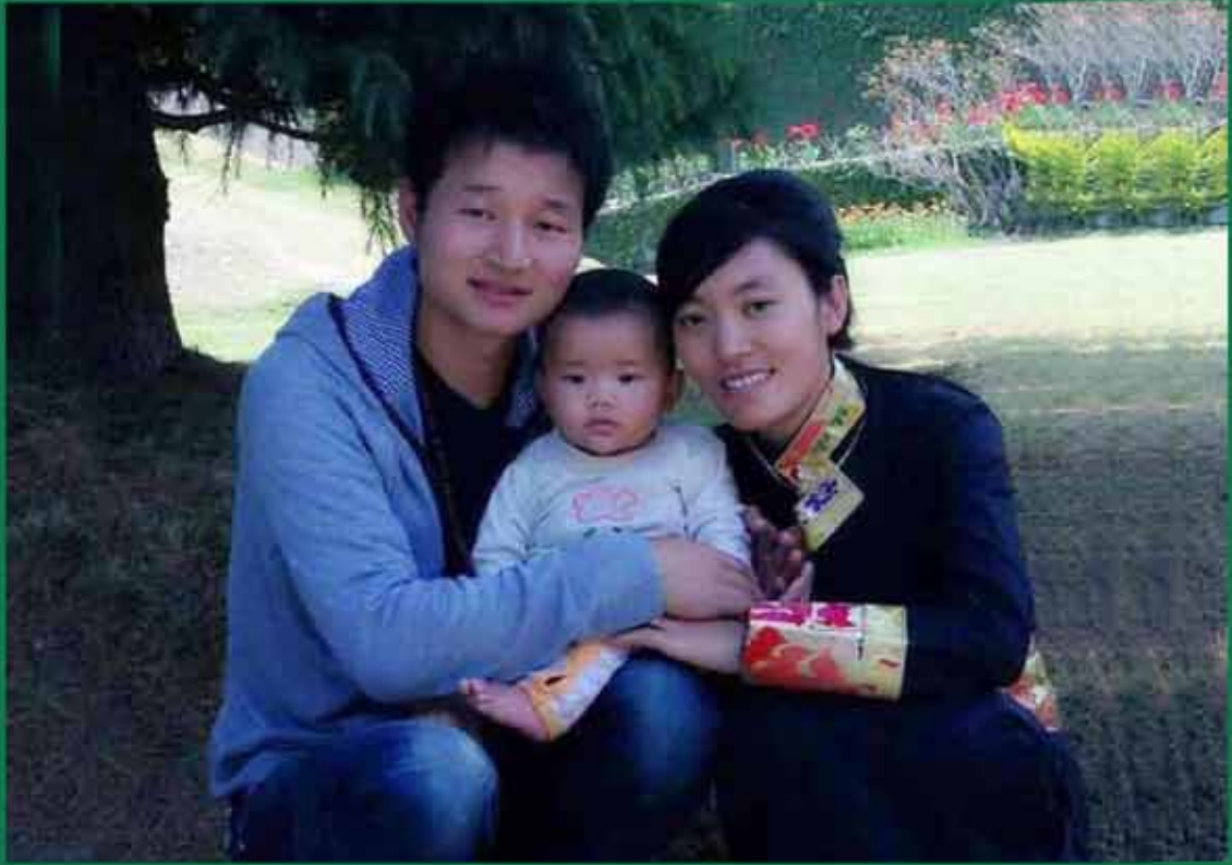
ནགས་ལྗེ་ལྷོན་མེ་འདོན་ཐེངས་དགུ་པའི་སྦྱོན་བདག བལ་ཡུལ་གནས་བཞུགས་ཤིང་ལཱ་ལྷན་པའི་ཐང་ལམ། བསྐྱར་འདོན་ཚོས་སྦྱིད། ལུ་མོ་མེ་ཉིག་ལྷ་མཛེས་བཅས་ཀྱི་བརྒྱན་པར།