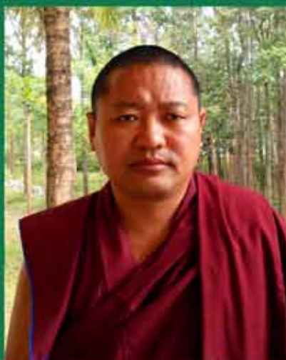
ཇམ་མཚན་ཇོ་མཚོ་འཕེལ་ལྷན་པོ།

Terzin Dhangal Namdroling Nyingmapa Monastery P.O.Bylakuppe-571104 Mysore Distt (K.S.) India Phone: 0091-8853229755 Facebook terzin@gmail.com